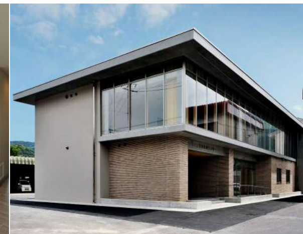
上齋原振興センター改築工事(鏡野町)