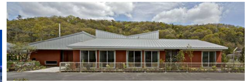
(仮称)グループホーム楽し愛新築工事(岡山市)