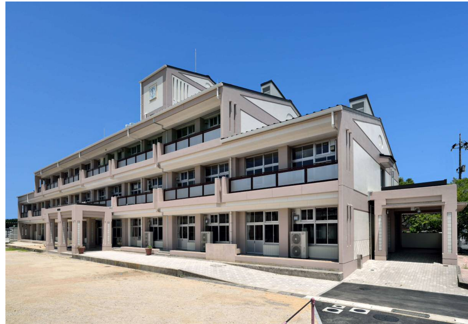
大崎小学校校舎大規模改修建築工事(津山市)