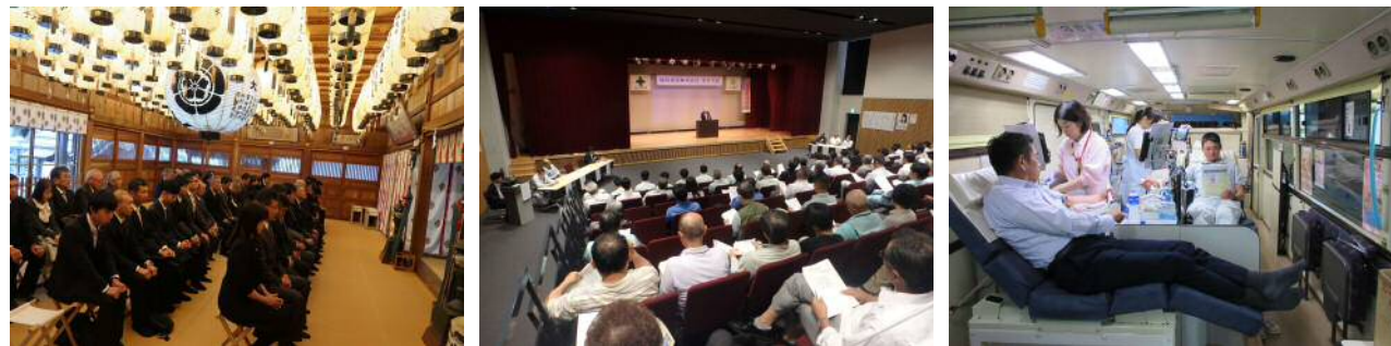
▲1月6日 木山神社参拝 ▲6月25日 安全大会(落合総合センター) ▲7月11日 献血(本社)