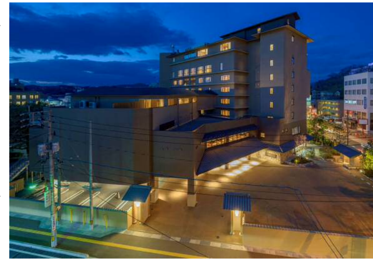
新津山国際ホテル建設工事(津山市)