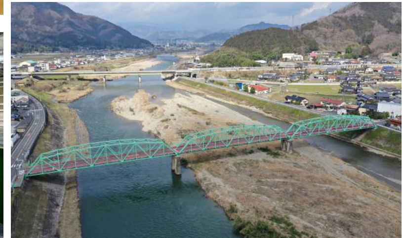
落合橋橋梁塗装修繕工事・防護柵修繕工事(真庭市)