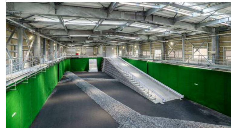
美作クリーンセンター最終処分場建設工事(美作市)