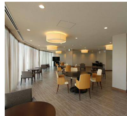
オーゼィウェルネスフィット'改修工事(岡山市)