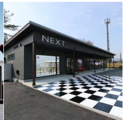
Dance Studio NEXT新築工事(津山市)