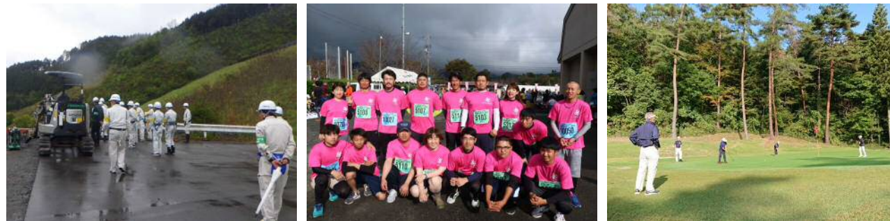
▲安全パトロール ▲マラソン同好会活動 ▲ジュニアゴルフ月例競技会