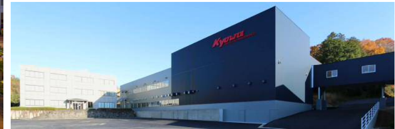
(仮称)共和機械(株)新工場増築工事(津山市)